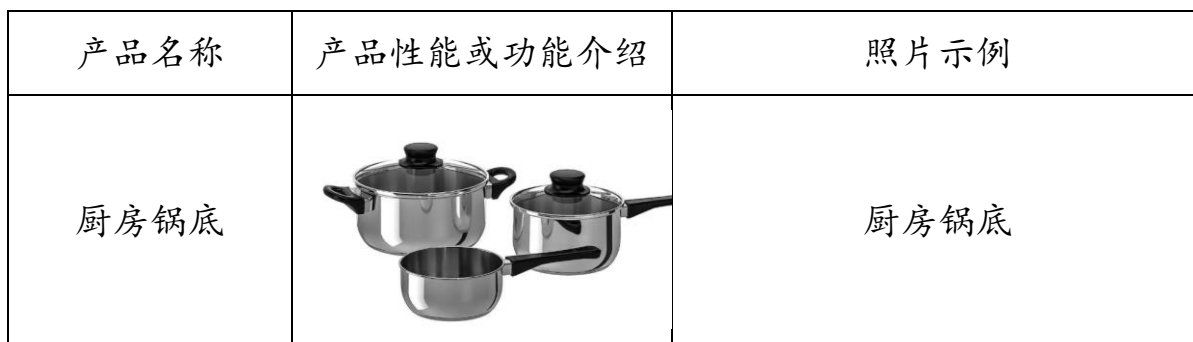
表 1 主要产品说明表